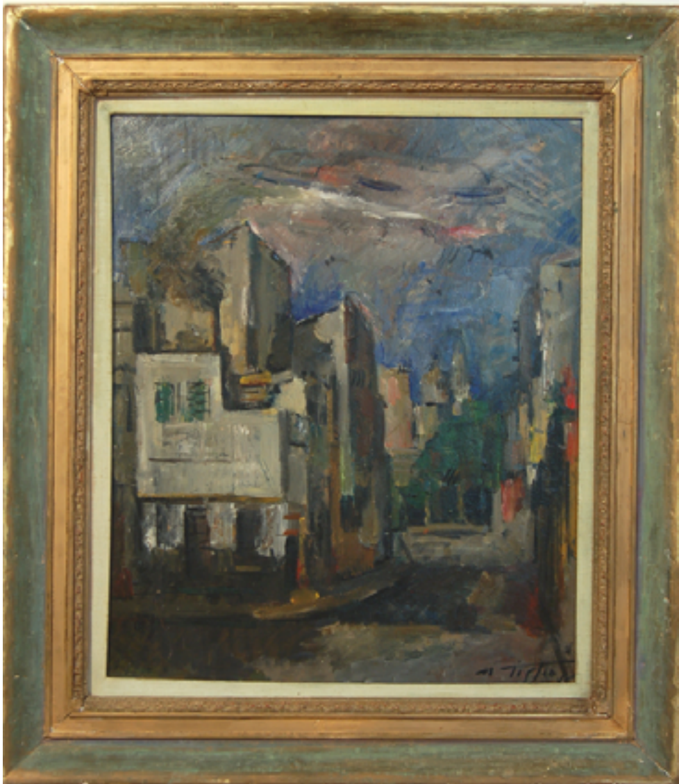
▶ Puebla, Martha / “La montaña azul” / Pintura / Año de realización 1952